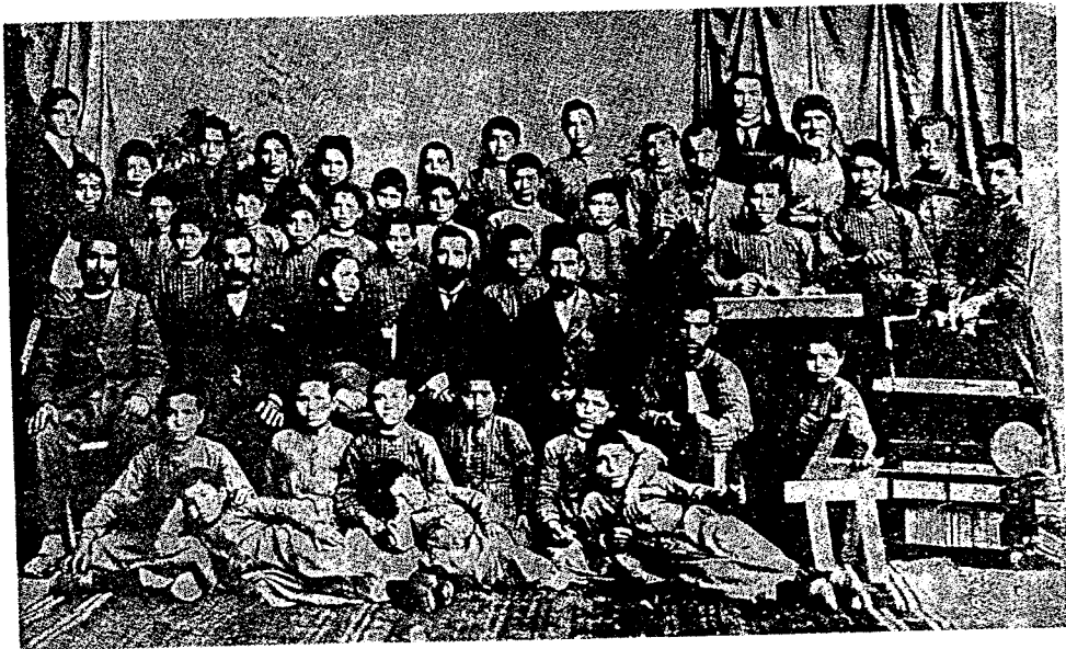
Որբանոց-դպրոցի մը աշակերտները Կիւրիւնի մէջ - 1895ի ապրիլի 11-ին -

Ուսանողի եւ ուսուցանողի փոխ-յարաբերութիւնները տրամաբանական եւ հոգեկան կապ մը ըլլալէ աւելի՝ տարօրինակ պատիժներ էին, առանց դատարանի վարժապետ անրնական երեւոյթ մըն էր: Աշակերտութիւնը զսպելու բազմաթիւ միջոցներ եւ պատիժներ ունէին: Երեւելի Փալախան, տիրապետող էր նաեւ Կիւրիւնի մէջ: Այս բոլոր դատան պատիժներուն դէմ որեւէ բողոք չէր ըլլար ծնողներէն կամ հոգաբարձութենէն: