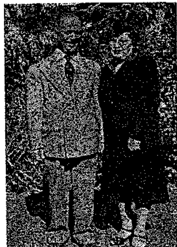
ՏՕԲԹ. Գ. Մ. ԽԱՆԿԱՄԱՆԻՐ (Տես, յօդուածը էջ 74)