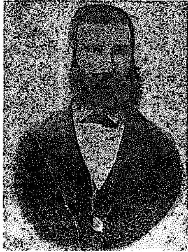
ՀԱՄԱԳԱՍՊ ՎՐԴ. ԵՂԻՍԻԵԱՆ (Առաջնորդ Տրապիզոնի)