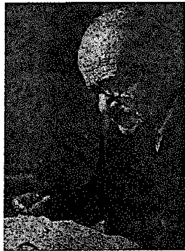
ՄԻՆԱՍ ՄԻՆԱՍԻԱՆ (Տեսուչ էջմիածնի ձեմարանի)