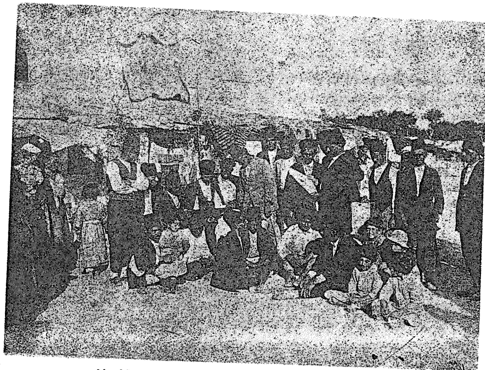
Կիւրիւնցիներ գաղթակաճութեան շրջանին Հալէպի մէջ