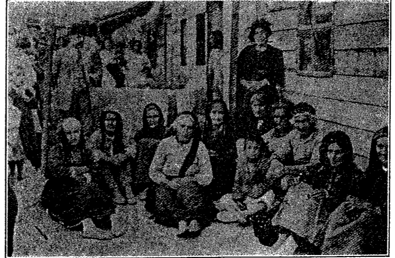
Կիւրինցի էժէներ Հալէպի Բեմքիմ մէջ

«Այս ամէնը թուելով հանդերձ, կը յուսայի որ հրաժարեալ վարչութիւնը մասամբ օրինաւորութեան սահմանի մէջ գործել ստիպուած էր եւ իր հաշուետը- ւութեան մէջ Կիւրինցիներէն խուսափելու