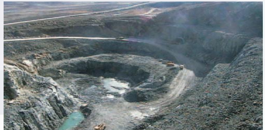
Raglan Mine (Nickel), extracted from www.infomine.com

GNL (Gaz Naturel Liquéfié), gazoducs/pipelines : encore à l'état d'ÉI ou récemment approuvés.