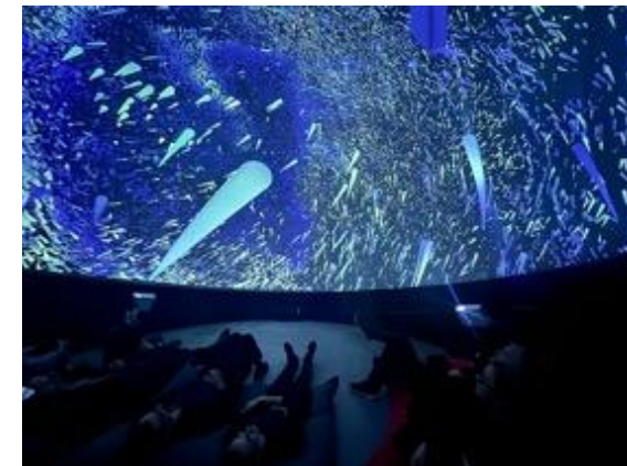
Un dôme de prototypage de 7 mètres de diamètre a été installé en permanence à l'école NAD.